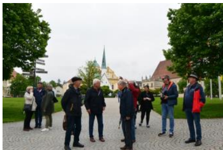
Wallfahrt Altötting, Burghausen, 16. Mai 2023