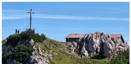
Hochfelln, 08. August 2023