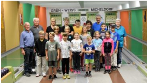
Ferien Aktiv - Kinderkegeln, 26. Juli 2023

Mehr Fotos unserer Veranstaltungen findest du auf unserer Homepage