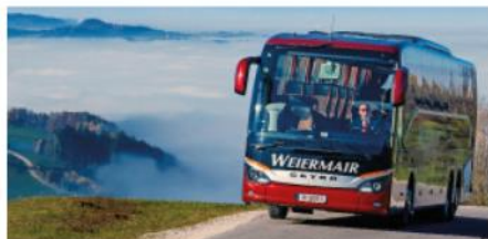
Ihre private Gruppenreise - perfekt organisiert

Mit Freunden oder Kollegen einen Ausflug oder eine Reise zu unternehmen macht doppelt so viel Spaß. Gerne planen und organisieren wir Ihr Vorhaben. Ganz individuell und auf Ihre Wünsche abgestimmt. Egal mit welchem Verkehrsmittel Sie reisen möchten, wir stehen Ihnen gerne kompetent zur Seite mit unseren Ideen und Kontakten zu Fluglinien, Hotels und Reiseleitern.