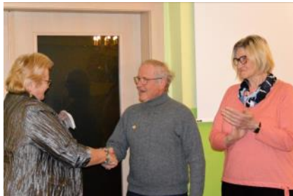
Jahreshauptversammlung, 13. Februar 2023