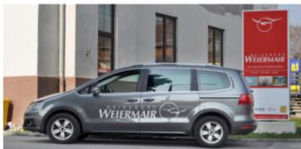
Krankentransporte - Flughafentaxi

Mit Freunden oder Kollegen einen Ausflug oder eine Reise zu unternehmen macht doppelt so viel Spaß. Gerne planen und organisieren wir Ihr Vorhaben. Ganz individuell und auf Ihre Wünsche abgestimmt. Egal mit welchem Verkehrsmittel Sie reisen möchten, wir stehen Ihnen gerne kompetent zur Seite mit unseren Ideen und Kontakten zu Fluglinien, Hotels und Reiseleitern.