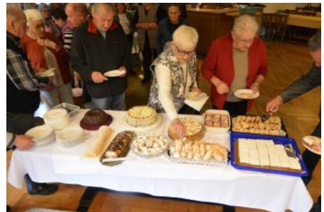
Sparverein-Auszahlung, 17. November 2023

Hol dir das Programm 2024 auf dein Smartphone