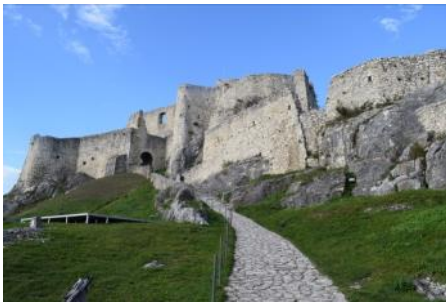
Bratislava und Zipserland, 18. bis 23. September 2023