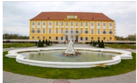
Schloss Hof und Carnuntum, 18. April 2023