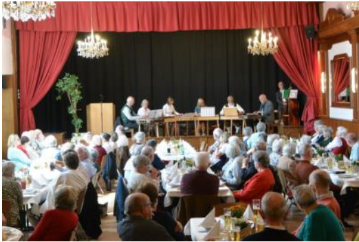
Muttertagfeier, 21. Mai 2023