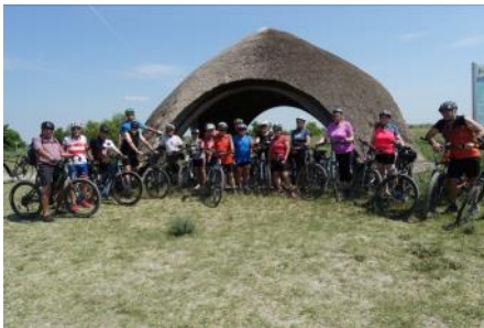
Radfahrtage Neusiedlersee, 19. bis 21. Juni 2023