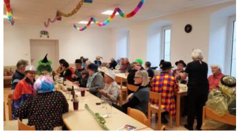
Sparverein-Fasching, 10. Februar 2023