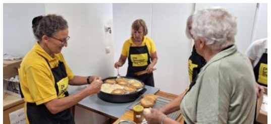
Sparverein-Grillfest, 11. August 2023